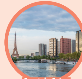
Front de Seine Beaugrenelle

2 sites emblématiques en gestion et en exploitation