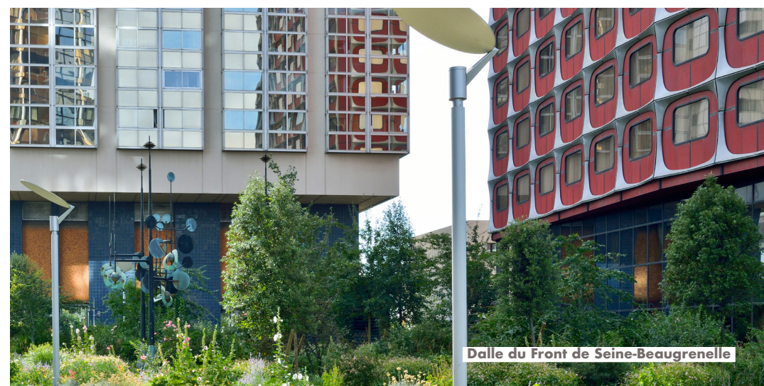
Dalle du Front de Seine-Beaugrenelle

PariSeine assure également la sécurité, l'entretien, l'exploitation quotidienne du Nouveau Forum des Halles, de la Canopée et des équipements publics pour le compte de la Ville de Paris.