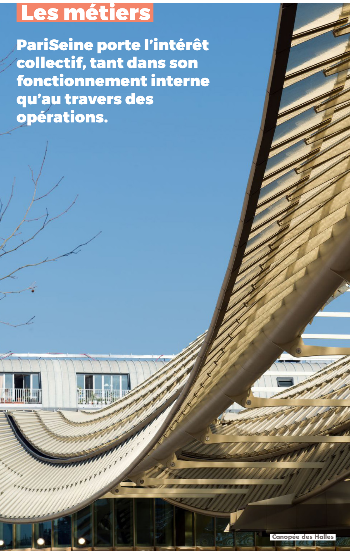
Canopée des Halles

PariSeine porte l'intérêt collectif, tant dans son fonctionnement interne qu'au travers des opérations.